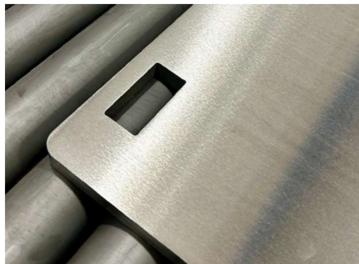
Ontbramen en slijpen